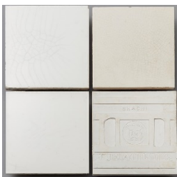
(1) 各社から発売された白タイル 右下はタイル裏面