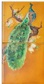
(2) 英国製の組絵タイル(左、30.4×15.2×1cm、1930年代)を手本に日本のタイルメーカーが制作したもの(右、33.5×35×4cm)