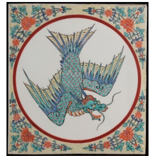
《柿右衛門色絵応龍文陶板》17 世紀（25.5cm×23.5cm×5.3cm）所蔵&写真提供：前坂晴天堂

6 世紀頃、大陸から仏教と共に伝来し、 敷瓦 、 腰瓦 や なまこ壁 として寺社仏閣や土蔵に使われた「瓦」に始まり、名称統一に至るまでの歴史を、「瓦」「タイル」「煉瓦」「テラコッタ」に分けて紹介します。見どころの一つは、京都・西本願寺の転輪蔵（1677 年建立）内部に張られている腰瓦「柿右衛門色絵応龍文陶板」と同種の実物展示です。奉納品としてつくられたため、西本願寺以外に伝世しているものが非常に少なく、間近に見られるまたとない機会です。鮮やかな絵付と勢いのある筆致で描かれた、四隅の唐草文と中央の応龍文を細部にわたってご鑑賞ください。