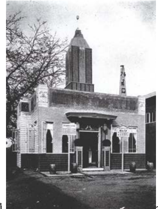
平和記念東京博覧会館。