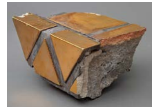
(4) ホテルオークラ東京(1962年竣工)に使われた三角形外装タイル(24.5×19×14cm)

(1)-(4) いずれも、INAX ライブミュージアム蔵 特記が無いものはいずれも撮影、梶原敏英