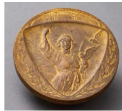
平和記念東京博覧会の金牌。出品項目17部、出品人員約7万5千、審査点数約14万のうち960点に金牌が授与された。(径6.3cm) INAX ライブミュージアム蔵

本章では、名称が統一されるに至った経緯を時代背景とともに紹介するほか、決議がなされた平和記念東京博覧会の敷地図、会場に展示された実験住宅「文化村」の絵葉書と図面、博覧会出品社/者の優秀作品に授与された金牌などを実物展示し、100年前の出来事を振り返ります。