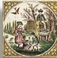
（写真 2）多彩子供絵プリントタイル イギリス・George Woolliscroft & Son 1895 年頃-1900 年 157×157×11 mm 服飾年代：19 世紀／撮影：梶原敏英