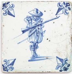
（写真 1）藍彩兵士図タイル オランダ 1625-1650 年 124×124×12 mm 服飾年代：17 世紀初頭

オランダ、スペイン、ポルトガル、イギリスほか数カ国の人物文タイル約 50 点を 9 つのグループに分け、それぞれキャッチコピーをつけて展示します。例えば、「 ユニフォームの起源 ミリタリーウェア 」では、主に 17 世紀の軍服をまとったオランダの人物文タイルが並びます。17 世紀はヨーロッパで軍服がユニフォーム化された時代です。タイルは当時も今も人気の、白地に藍彩が美しいデルフトタイルです（ 写真 1 ）。時代は下り「 子供服の誕生 」は主にイギリスのタイルから。19 世紀まで子供服のデザインは成人服と同じでしたが、19 世紀ヴィクトリア女王時代のイギリスで子供服独自のものとなりました。セーラー服も子供服として大流行（ 写真 2 ）。