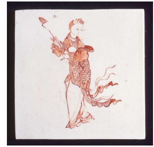
（写真 4）赤絵仙女図陶板 中国・楓溪窯 19 世紀末-20 世紀初頭 上絵 125×125×9 mm

紀元前より続く、中国の服飾史。上流階級の服制は時の覇者により改正されてきましたが、漢民族が好んだ比較的ゆったりとした衣服がベーシックアイテムでした。ここに並ぶ 18 点の中国タイル（陶板）にも、漢民族の服装（漢服）を着用した表現が多く見られます。これらは後世、陶板をつくった時代の人びとがイメージした漢服のため、時代の特定がむずかしいですが、明・清時代をベースに描いていると想定されます。「ヒラヒラ揺れる飄逸感」で展示される赤絵仙女図陶板（写真 4）は幸せの神々「八仙」のひとり、何仙姑（かせんこ）。スカートや肩のストールからシルクのしなやかな動きが見て取れます。