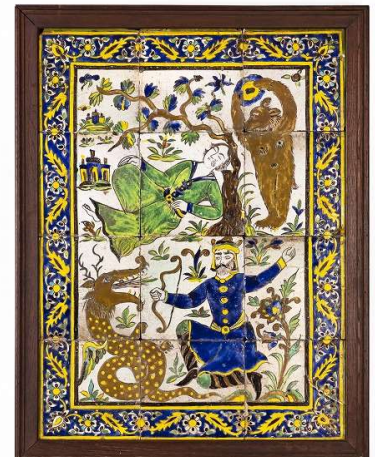
（写真 3）多彩物語図組タイル イラン 19 世紀後半～20 世紀 クエルダ・セカ 1035×800×45 mm（額含む） 服飾年代：17 世紀

イスラームからは 17～20 世紀につくられたイランのタイル 10 数点を 3 つのキャッチコピーのもとに分けて展示します。イスラーム化後の中東、特にイランでは、遅くとも 13 世紀初頭までに、男女共通の、長衣とブーツとを組み合わせた装いが定着していたようです。キャッチコピーのひとつ、「 ユニセックスでいこう 」で展示される多彩物語図組タイル（ 写真 3 ）は一つの絵に二つの物語が描かれています。下部に描かれた人物は怪物を退治する王です。王が着ているボタン付きのチュニックは、略式の軍衣と思われます。