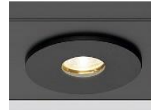
ダウンライト DL-G2 型