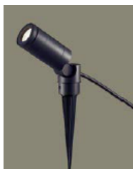
スパイクスポットライト