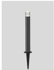
ローポールライト丸形