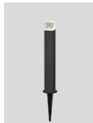
ローポールライト角形