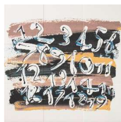
中尾 涼 (在籍：やまなみ工房)