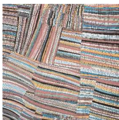
八重樫 道代 (在籍：るんびにい美術館)