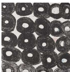
佐々木 早苗 (在籍：るんびにい美術館)