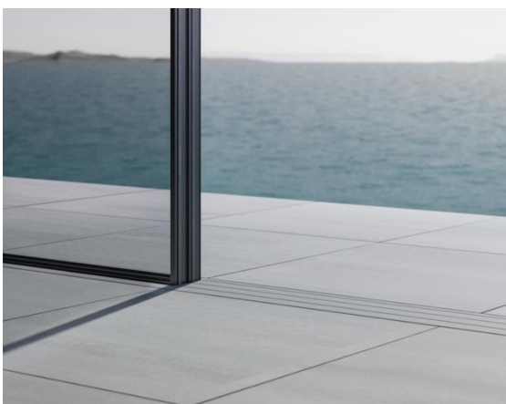
下枠のフレームカバー