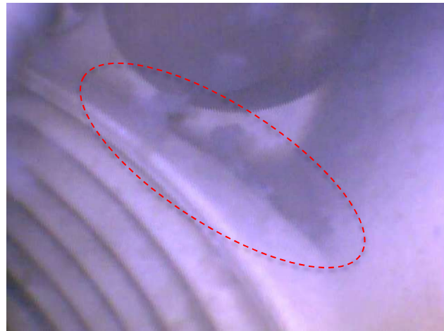
右：機器配管内部の汚れ 赤破線内がバイオフィーム

浴室のお手入れは定期的に行っても、追い焚きなどの配管内のお手入れは定期的に行わないことが多いかと思えます。この配管内は、人間の皮脂汚れを主成分としたバイオフィームが発生・付着しやすく、お手入れが行き届いた浴槽においても、フワフワと浮遊するカスのような汚れがでてくる可能性があります。そもそもバイオフィームとは、数種の細菌がコミュニティを作って増殖した微生物の集合体のことです。細菌が薬剤などの外的要因から身を守るため、キッチンやお風呂の排水口、川底の石にヌルヌルとした膜や、お口内の細菌のかたまりである歯垢などがバイオフィームに該当します。