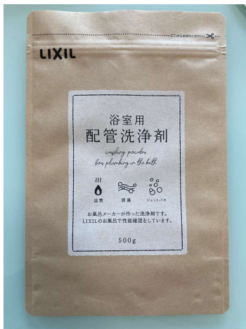
左：浴室配管洗浄剤 PKG

URL: https://parts.lixil.co.jp/lixilps/shop/campaign/haikansenjyouzai/