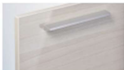
DN2 (ノースウッドホワイト)