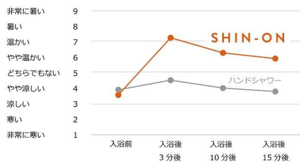
湯温42℃設定で5分入浴後、室温22℃一定、上裸の同条件下で比較 被験者11人のうち、有効測定データが得られた9人分データの平均値 場所：LIXIL新実験住宅「みらいえらぼ」（埼玉県越谷市） 被験者：20代～50代の男性11名 実験期間：2023年2月1日～2月27日