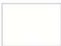
プレシャスホワイトA