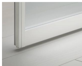
プレシャスホワイト