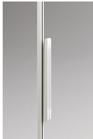
プレシャスホワイト