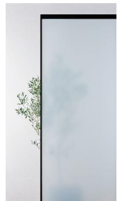
フロストホワイト