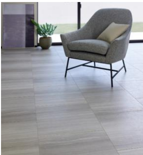
セルベジャンテ調 455 (幅広)