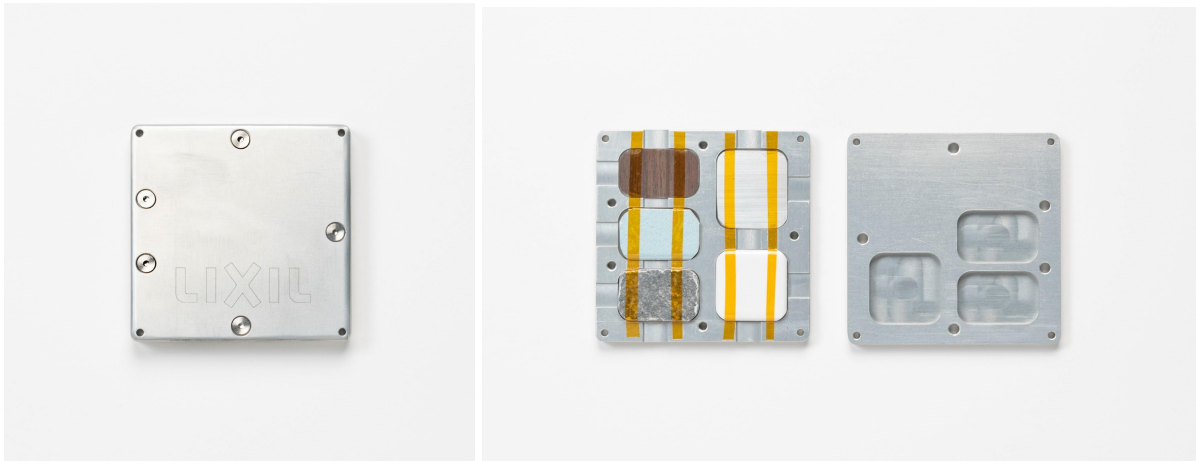
&lt;ExBAS搭載用サンプル5種イメージ&gt;