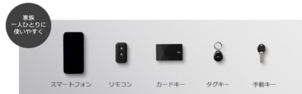
5タイプのカギから、家族一人ひとりの使いやすさに合わせて、自由にセレクト可能