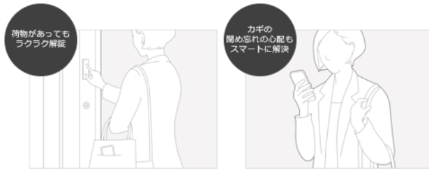
ポケットインで素早く施解錠

スマートフォンを“ポケットイン”の状態ですぐにドアの施錠・解錠が可能なスマートロックシステム「FamiLock」を標準搭載。電池式、電気式どちらも設定しています。