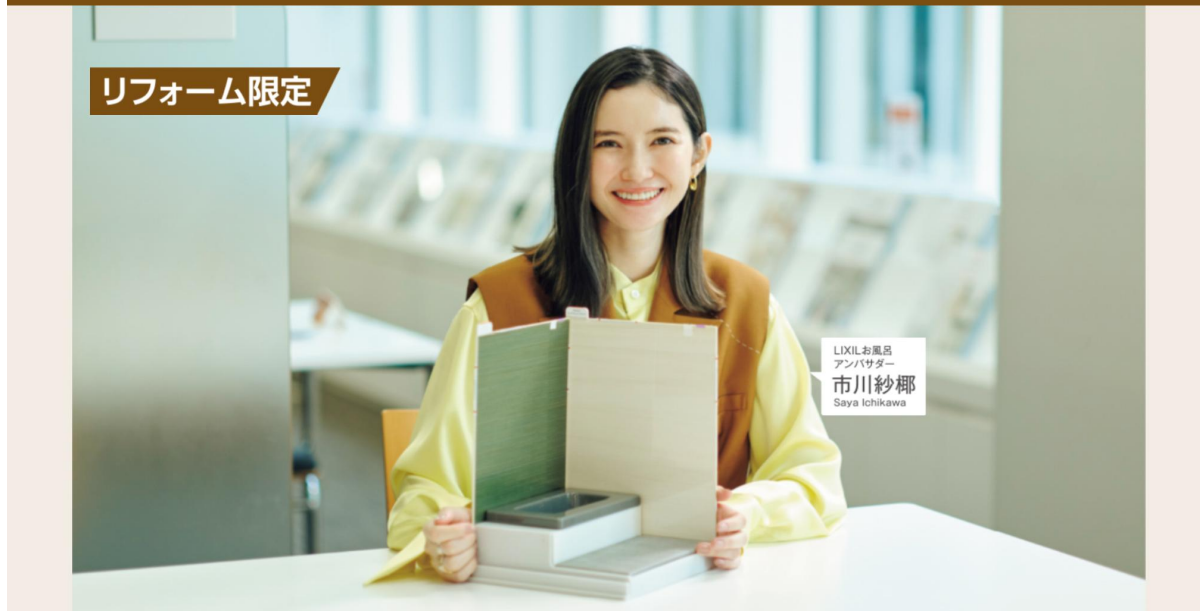
LIXILお風呂 アンバサダー 市川紗椰 Saya Ichikawa

ストレスなどによる疲れを軽減し、癒しの空間を提供してくれるお風呂。使用頻度が高い場所だからこそ、デザインにもこだわりたいものです。LIXILでは、シンプルなものから個性的なものまで、お客さまのお好みに合わせて浴室空間をスタイリングできるよう、バリエーション豊富な壁柄をご用意しています。今回の壁パネル無料アップグレードキャンペーンでは、メーカー希望小売価格より最大14万円もお得となります。この機会に、自分好みの心地よいバスルームを実現してみませんか？全国のLIXILショールームにてお気軽にご相談下さい。LIXILは今後も、浴室をはじめ、さまざまな商品・サービスを通じて、誰もが願う豊かで快適な住まいの実現に向けて貢献していきます。