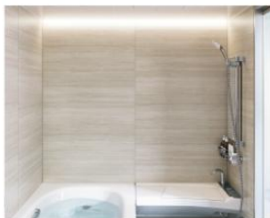
全面張り：セルベジャンテ/HG262