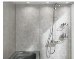
全面張り：ロッシュグレー/HF333