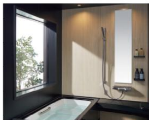
アクセント張り：ランダムウッド/HT541× EBブラック/LE707