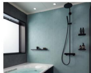
アクセント張り：ヘリンボーンミント/HT615× マルチオダーク/HT614