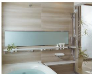
アクセント張り：クオーレボブラ/HF336× スタックページ/HT613