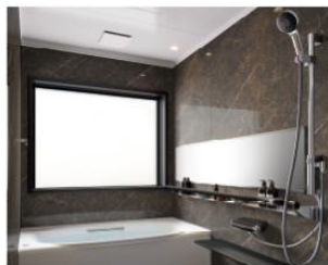
全面張り：コレマンディーナ/HF334