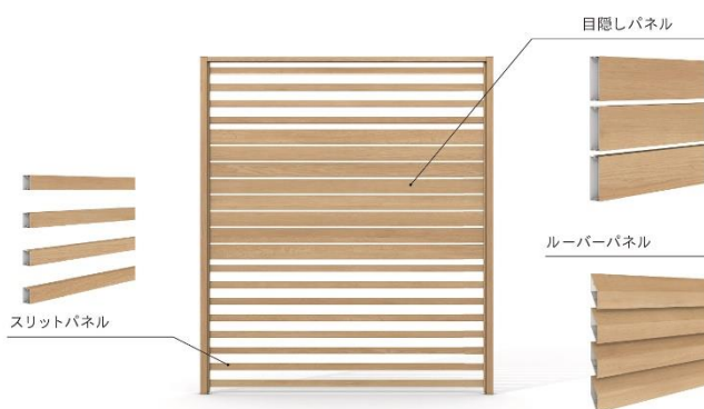
プライバシーの確保、通風性、採光性から 3種類のパネルを組み合わせ選べます