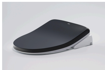
ノーブルブラック

空間に彩りを与えるノーブルブラック・ノーブルグレーと、ベーシックなピュアホワイトから選べます。