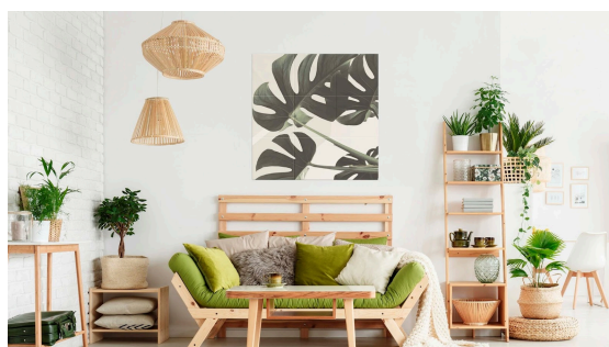
(左) [アール・ブリュット]57施工事例、(右) [アート&フォト]113施工事例