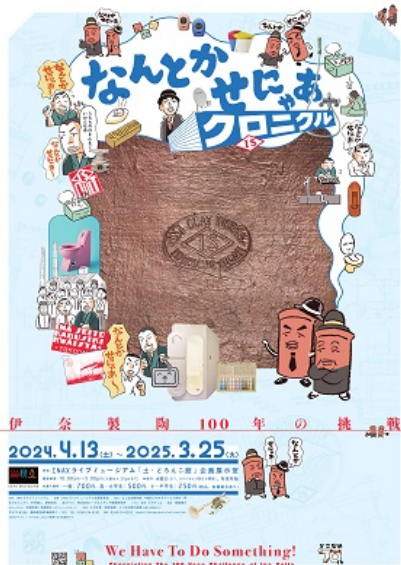
企画展ポスター画像

株式会社 LIXIL（以下 LIXIL）が運営する、土とやきものの魅力を伝える文化施設「INAX ライブミュージアム」（所在地：愛知県常滑市）では、2024年4月13日（土）から2025年3月25日（火）まで、企画展「なんとかせにゃあクロニクル—伊奈製陶 100 年の挑戦—」を開催します。2024年、LIXIL の水まわり・タイル事業は 100 周年を迎えます。本展では、1924 年に設立した伊奈製陶から INAX（現 LIXIL）に至るものづくりの歴史を、年表とエポックメイキングな製品や技術など 100 点以上の実資料で展観し、先人たちの創意工夫をひも解きます。