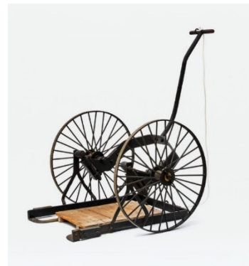
写真 3：伊奈式運搬車

1888（明治 21）年 W620×D280×H356cm LIXIL 蔵