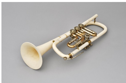
写真8（左）：セラミックス楽器「トランペット」 1989（平成元）年頃 W460×D205×H205mm LIXIL蔵

やきものの孔の形状や量をコントロールし、機械加工が可能な機能素材「マシナブルセラミックス」を開発し、1989（平成元）年に名古屋で開催された世界デザイン博覧会においてセラミックス楽器（写真8）に応用しました。また、FRPの軽くて錆びない特性と、浴槽づくりで培った技術と経験をもとに「パラボラアンテナ」（写真9）を開発。国内だけでなく国際的にも注目を集めます。いずれも事業は継続しませんでした。技術者の研究から誕生した開発事例にもスポットをあてます。