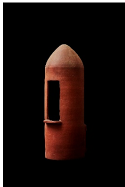
写真 2：家外小便所 復元品

19 世紀（江戸時代末期） W65×D70×H80 mm 中村真二蔵