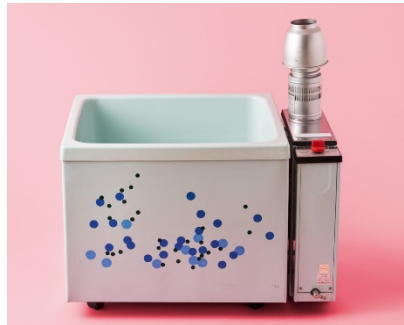
写真5：バランス釜（ポリセット） 1981（昭和56）年 W980×D700×H1030mm LIXIL蔵