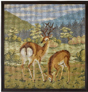
写真4：ラスモザイク壁画「鹿」 1935（昭和10）～1940（昭和15）年頃 W1705×D32×H1770mm LIXIL蔵

戦後は衛生陶器など水まわりに関わる製品の開発製造へと展開しました。後に、新素材として注目されていたFRPに着目し、試行錯誤の末、1958（昭和33）年にポリバス（FRP浴槽）を開発。軽く施工が楽なこの素材を進化させながら「バランス釜」（写真5）などの新商材が生まれます。また、1967（昭和42）年には国産初の温水洗浄機能付便器「サニタリイナ61」（写真6）を発売。技術者たちが未経験の新しい機能開発に悪戦苦闘の結果、生み出した画期的な製品をご紹介します。