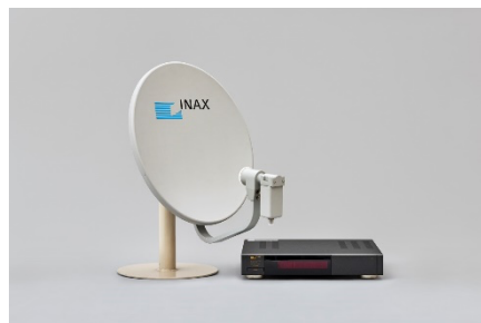
写真9（右）：パラボラアンテナとチューナー 1988（昭和63）年頃 アンテナ W360×D600×H540mm チューナー W340×D320×H65mm LIXIL蔵