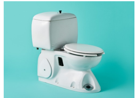
写真6：サニタリイナ61 1967（昭和42）年 W470×D800×H830mm LIXIL蔵