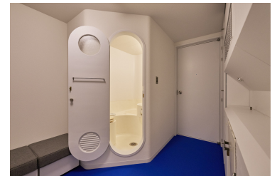
写真7：中銀カプセルタワービル内部。ユニットバスの扉をあけた様子

建築家・黒川紀章の設計により、1972（昭和47）年に東京・銀座に竣工した〈中銀カプセルタワービル〉は、140基の着脱可能なカプセルユニットで建築運動「メタボリズム」の傑作といわれています。そのユニットバスを手がけたのが伊奈製陶でした。ほぼ納材当時の仕様そのまま現存するカプセルが「どろんこ広場」に登場。内部空間は円型窓越しにご覧いただけます。