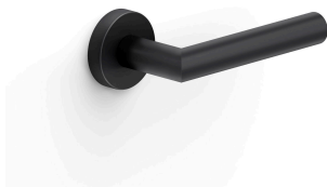
グラファイトブラック