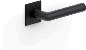
グラファイトブラック