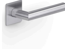
マットステンレススチール