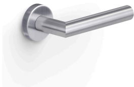
マットステンレススチール