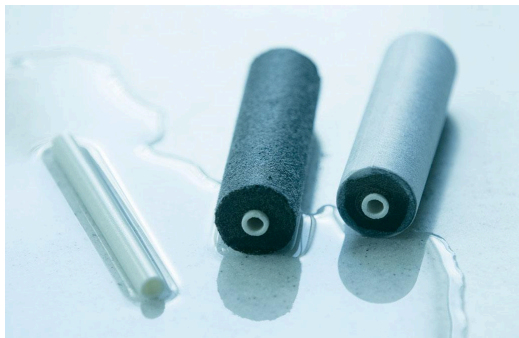
左から順に、セラミックフィルター、+活性炭フィルター、+不織布フィルター

浄水として、まず担保されるべきなのは飲用水としての安全性です。LIXILでは、セラミックフィルターの製造、活性炭のブレンド、そしてカートリッジの組み立てに至るまで、すべてを自社の国内工場で実施し、業界最高水準の試験体制、品質管理で、日々その技術向上に取り組んでいます。