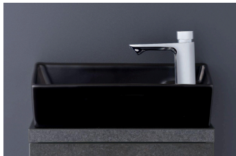
ノーブルブラック