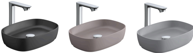
ノーブルブラック