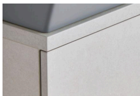
グレースホワイト