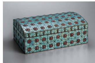
左から①《笛を吹く人》昭和初期 W273×H337mm 個人蔵 ②《花》昭和30年代 W584×H658mm 個人蔵 ③《鳥》昭和34（1959）年 W1010×H680mm 個人蔵 ④《飾箱》昭和10年代 W294×D177×H115mm 個人蔵