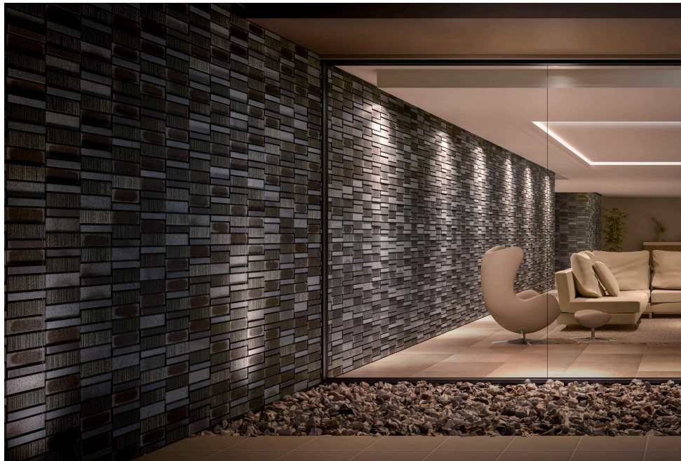
新商品「火色音 さわらび」と既存品「火色音 土もの」の組み合わせ張り

株式会社LIXIL（以下LIXIL）は、湿式製法タイルの主力製品である「火色音」シリーズから、質感や色などの意匠性を向上した「火色音 ひぼし」や「火色音 さわらび」の2商品を新たに追加し、2025年4月1日より全国で発売開始します。