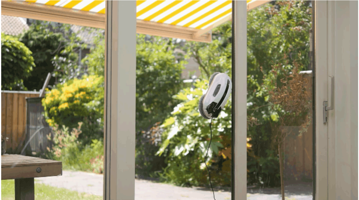
（写真）自動窓掃除ロボット「HOBOT-R3」掃除している様子

窓からの景色がクリアになり、自然光がたっぷり入り部屋全体が明るくなります。また、スイッチひとつで窓にピタッと密着し掃除してくれるので、上の方まで届かなかったり、しゃがんだり立ったりと結構体力を使う窓拭きのお悩みを解決します。時短（タイパ）家電の『HOBOT』を取り入れることで、時間を効率的に使うことができます。