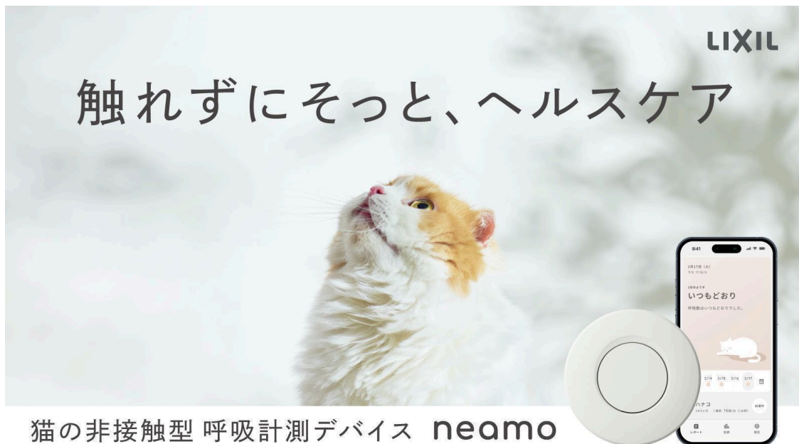
図3 LIXILが製品化した「neamo（ニアモ）」キービジュアル

共同研究による精度検証の成果を活用し、LIXILは猫の体に触れることなく安静時の呼吸数を計測できる非接触型呼吸計測デバイス「neamo」を開発・製品化しました。デバイスで計測した呼吸数は専用アプリで確認でき、呼吸数が「いつもどおり」かどうかを判定し、通知する機能も備えます。本製品は、LIXIL独自の製品設計により、飼い主のプライバシーを保護しつつ、猫がお気に入りの場所でリラックスしている間に自動で健康管理を行うことを可能にしています。2026年2月より「Makuake」にて販売を開始しています。（図3）