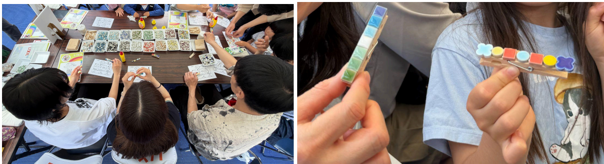
大人から子どもまで楽しんだクリップづくり 個性光る配色でふたつとないクリップが完成

LIXILの事業をより身近に感じていただくために、水まわり製品づくりの中心地である愛知県常滑市にあるLIXILの文化施設「INAXライブミュージアム」による参加型企画「オリジナルのモザイクタイルクリップづくり」も開催しました。参加者は思い思いにカラフルなタイルを選び、配置するワークショップを通じて、多様な色がひとつになることの楽しさを体感いただきました。