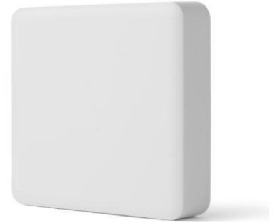
Life Assist2 ホームデバイス